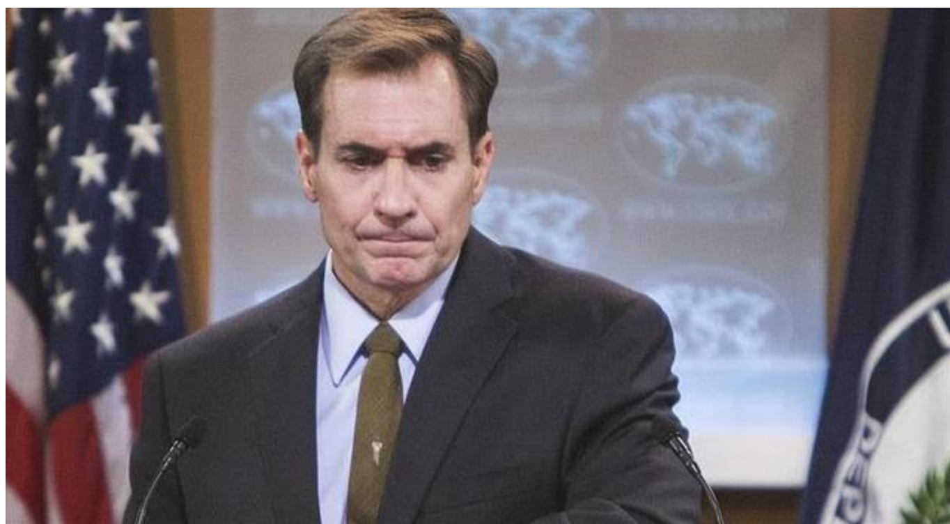
据央视新闻，有叙利亚剖析人士称，“伊斯兰国”再次攻打巴尔米拉可能是为了扩大周旋规模。